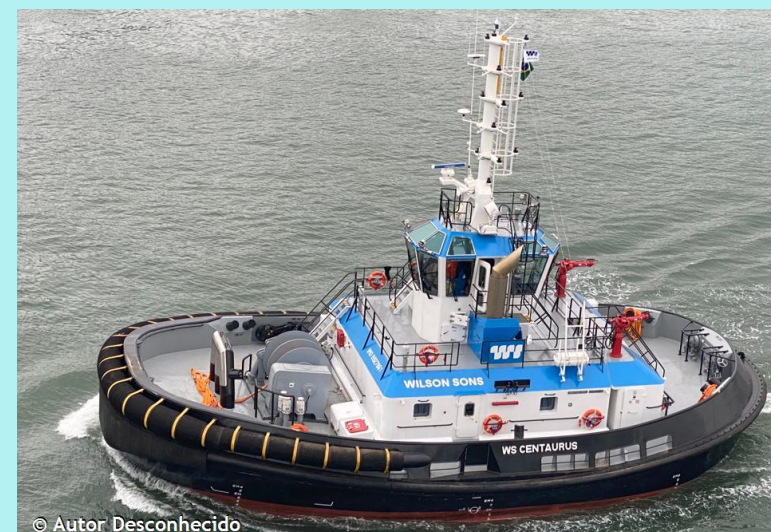
Fig 2. WS CENTAURUS, [4] [5], [6].

Comprimento: 24.73 metros Boca: 12.5 metros Calado: 3,7 metros Velocidade máxima: 6,4 nós Velocidade média: 5,7 nós Potencia motor principal: 5050 kW Bandeira : Brasil [BR] Ano de construção : 2023 Tonelagem Bruta : 327 t IMO : 9927861 Toneladas de tração estática: 91,4 TBP